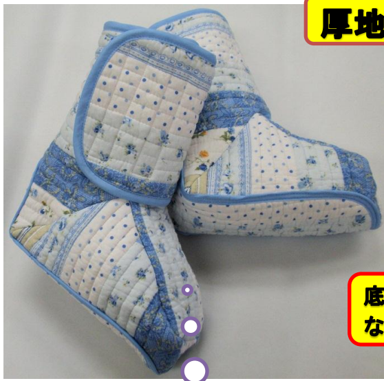
厚地キルトで安心ブーツ