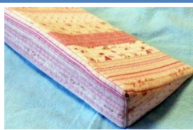
三角型・多機能クッション