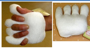
にぎにぎ・クッション