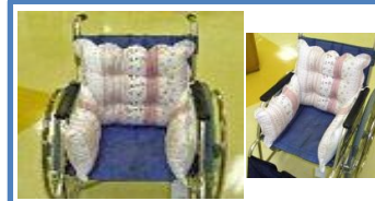
サイドアーム付クッション