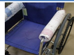
車椅子用・肘掛カバー